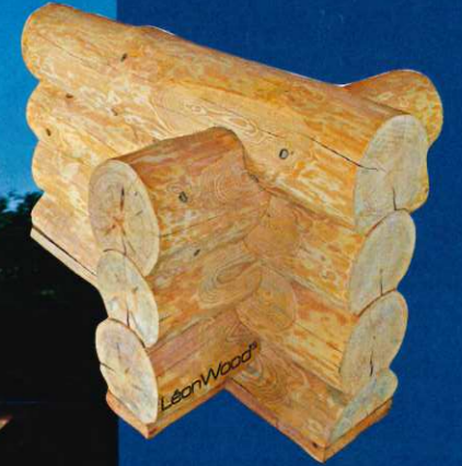
„Naturstamm“ round“ aus 25 cm Polarkiefer