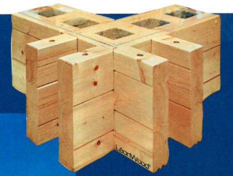
„Bio - Doppelwand“, 2 x 7 cm Blockbohle inklusive 13 cm Korkdämmung