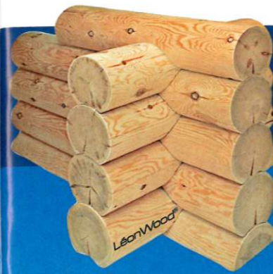
„Nordic- round“ aus 25 cm handgeschälter Polarkiefer