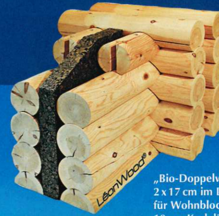
„Bio-Doppelwand round“, 2 x 17 cm im Durchmesser für Wohnblockhäuser, 10 cm Korkdämmung