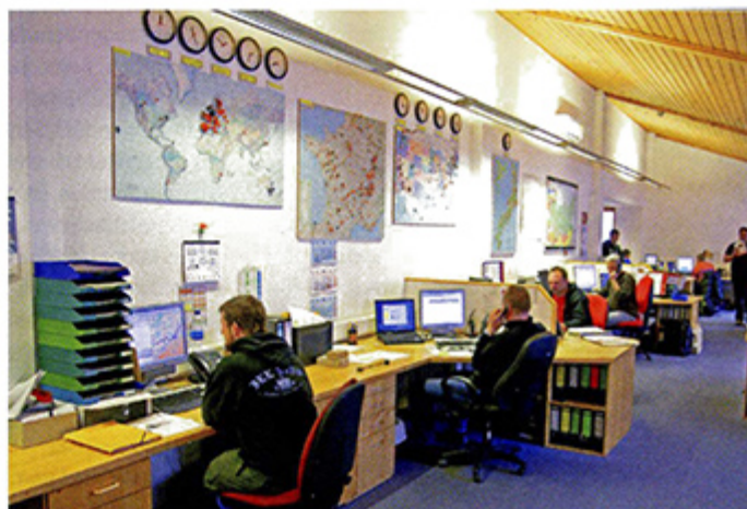
Servicebüro: Die Hundegger-Mitarbeiter in Hawangen sind fast rund um die Uhr erreichbar

das Fundament einer guten, langjährigen Zusammenarbeit.“