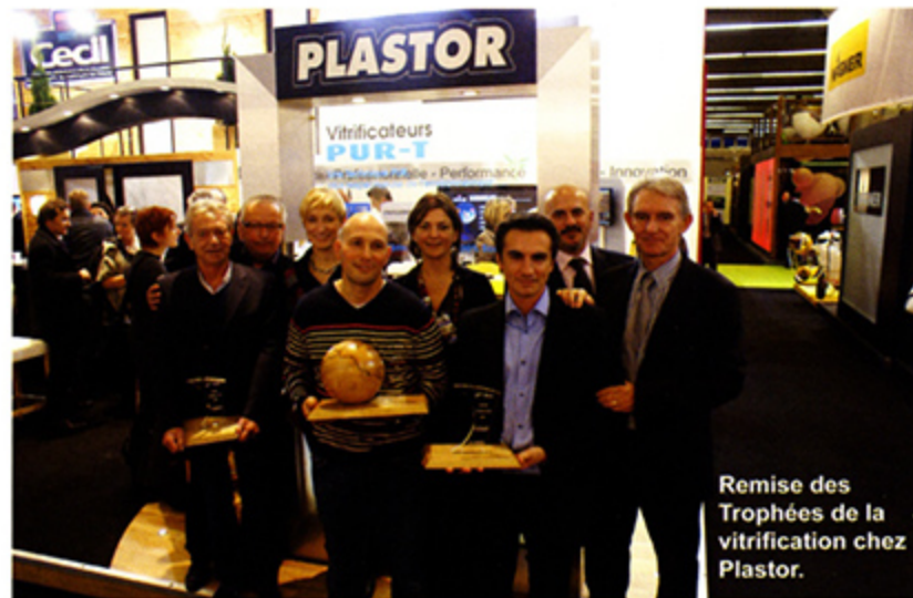
Remise des Trophées de la vitrification chez Plastor.

Avec la Coupe du Monde de football 2014 et les Jeux Olympiques d'été 2016, le Brésil, en forte croissance économique, est au coeur de nombreux projets de grande envergure à la pointe de la construction. Le Rendez-vous des Architectes, congrès de référence, se consacrera le mercredi 9 novembre après midi au Brésil avec un focus sur deux grands projets culturels intégrés au paysage urbain, le renouveau du Port de Porto Alegre ou comment concevoir de grands bâtiments en harmonie avec la ville. Le lundi 7 novembre, la Fédération des Industries de Sao Paulo, Ubifrance