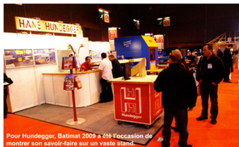
Pour Hundegger, Batimat 2009 a été l'occasion de montrer son savoir-faire sur un vaste stand.

[Le Concours de l'Innovation et Les Trophées du Design.]