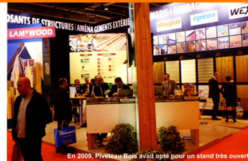
En 2009, Piveteau Bois avait opté pour un stand très ouvert.

Avec ses deux événements majeurs, très attendus par les exposants et la presse, Batimat se veut révélateur des innovations et tendances. L'objectif du Concours de l'Innovation est de récompenser et de promouvoir les innovations techniques sur les marchés de la construction. Les Trophées du Design récompensent les fabricants qui lancent de nouveaux produits conçus en partenariat avec des designers intégrés ou non. En 2009, 154 innovations ont été présentées par 117 exposants et 47 produits ont été nommés. Au final, 27 produits ont été lauréats et mis en lumière sur le salon. Pour renforcer