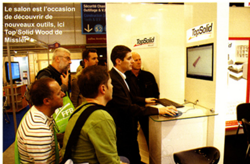
Le salon est l'occasion de découvrir de nouveaux outils, ici TopSolid Wood de Misslér

Brésil et l'ambassade du Brésil en France feront une présentation du formidable marché de la construction au Brésil et des projets liés à la coupe du Monde de Football 2014 et aux Jeux Olympiques de 2016. Sous des latitudes plus proches de nous, le 8 novembre sera la journée de l'Allemagne. De nombreux architectes viendront présenter des projets articulés sur l'objectif qui consiste à concilier performance énergétique, confort et amélioration des relations humaines. L'impact des principes de développement durable sur la construction et son environnement fera l'objet d'un comparatif des meilleures pratiques en France et en Allemagne.